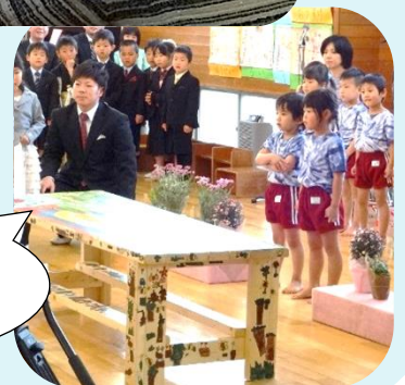
びわぐみの卒園製作 園庭用 ままごとテーブル