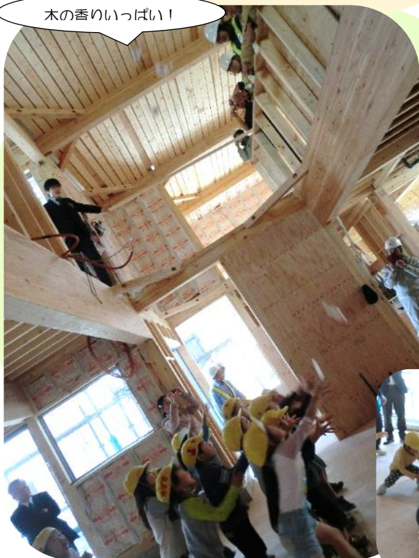
木の香りいっぱい!