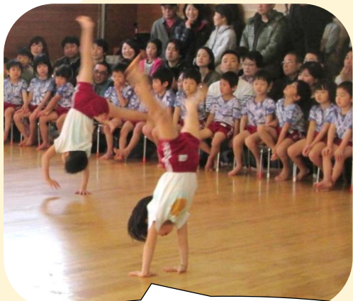
5歳児びわぐみの倒立がえる。 肩にしっかり体重をのせています。