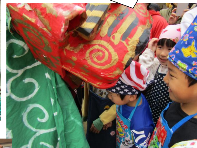
火の神様じゃ! とんど焼きのためにきてやったぞ!