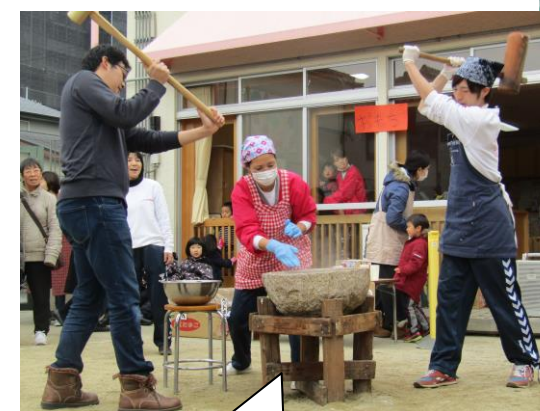
おもちつき! お父さんも一緒に よいしょ~!! よいしょ~!!