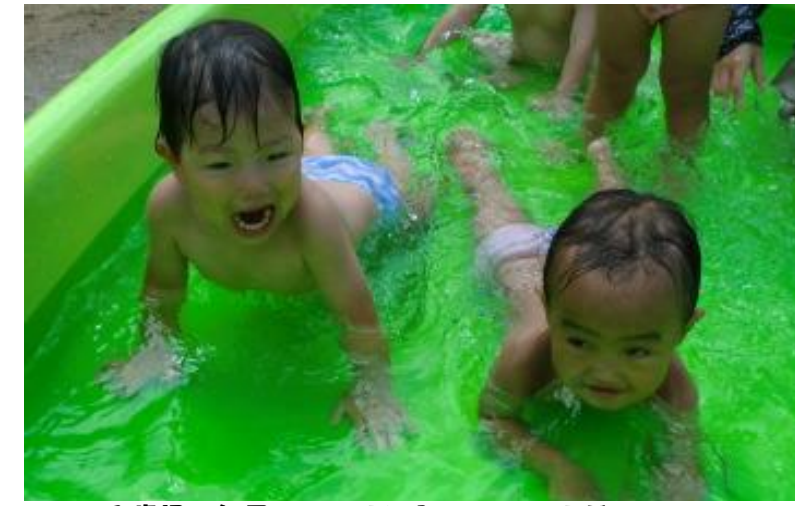
1歳児 毎日のプールに入ってプールが大好きになりました

本格的な夏が到来し、毎日暑い日が続いています。あまりの暑さに夏まつりでは心配しましたが、体調を崩すといったこともなく、みなさんのご協力により楽しいひと時を過ごせました。