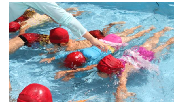
4歳児 身体のと唐を抜いて「ゆうれいさん」フカフカ浮いて気持ちいいよ！