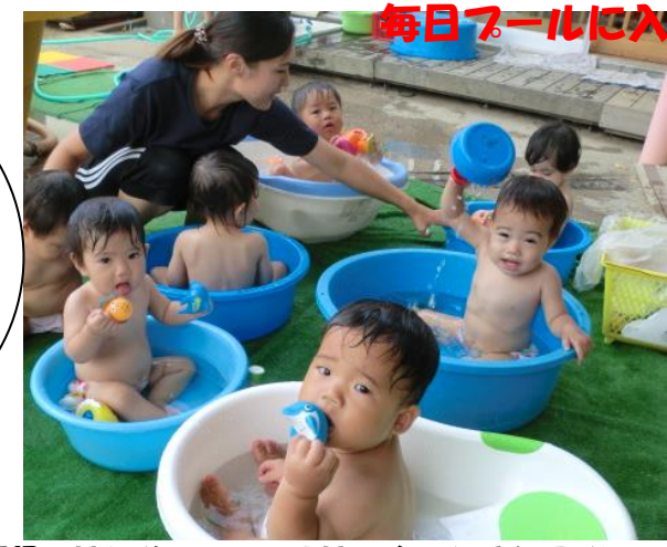
毎日プールに入って水とおともだちになったよ

ひむろこだま保育園園だより 〒569-1141 高槻市氷室町1-21-12 TEL 072-695-1516 <2018年8月1日発行>