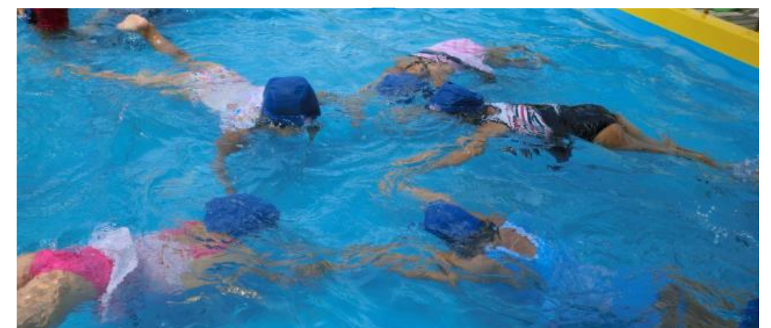
5歳児の子ども達 お友だちと手を繋いでお花をつくりました。水とすっかり友だちになりました。