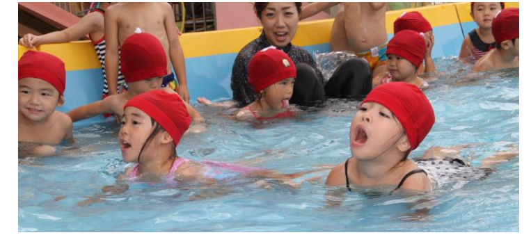
3歳児のワニさんパッ！顔にみずがかかっても平気だよ